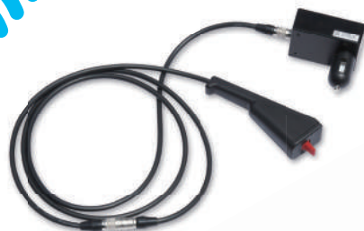
全旋回グラスパー ダイナ リモコン送信機セット

GV-62SD GV-122SD GV-202SD ※写真は GV-62SD です。